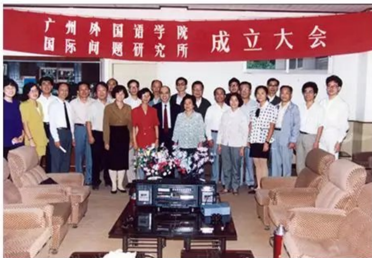
广东外语外贸大学国际关系学院揭牌仪式暨“中美关系与世界权力转移”学术研讨会

国际关系学院现有政治学一级学科硕士点和国际关系、政治学理论、外交学三个二级学科硕士点，其中政治学理论和国际关系为广东省特色重点学科。