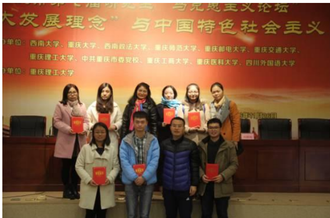
参加重庆市研究生马克思主义论坛