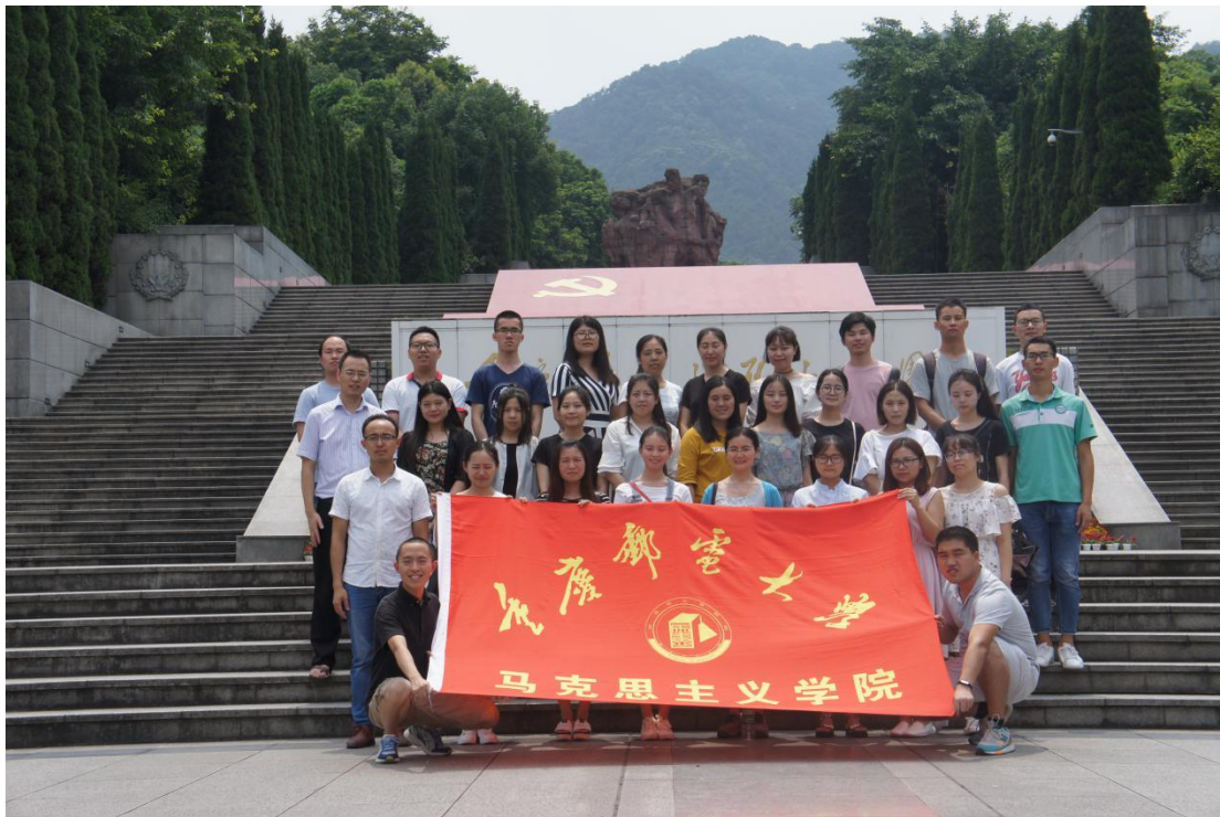
马克思主义学院组织开展“不忘初心 砥砺前行”研究生党团活动