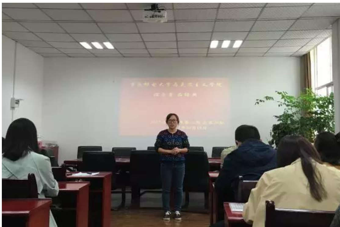
马克思主义学院研究生开展“读原著 品经典”系列读书活动