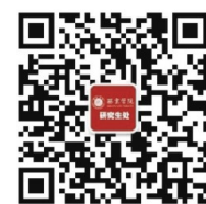
西京研究生微信二维码