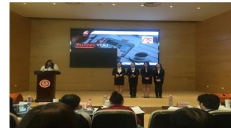
“赣粤高速杯”案例分析大赛