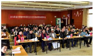
中外研究生文化交流会