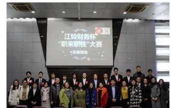
“江铃财务杯”职来职往大赛