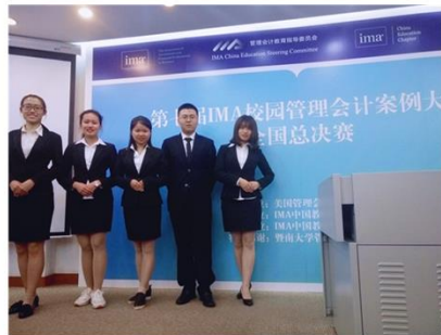
管理会计案例大赛