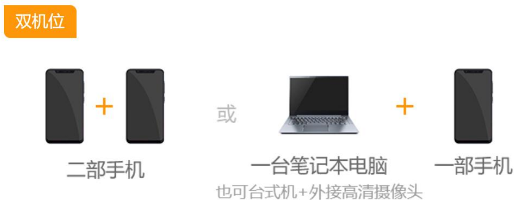
图 2 双机位的组成

1. 要求使用“双机位”，即电脑 1 台和智能手机 1 部；或智能手机 2 部，如图 2 所示。