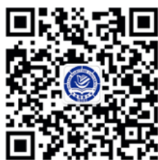
海大官方微信二维码