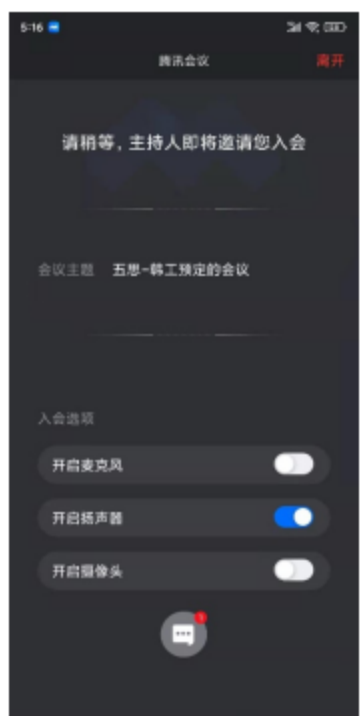
查看面试秘书指令