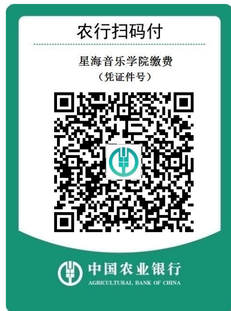
步骤 4: 扫描图中二维码