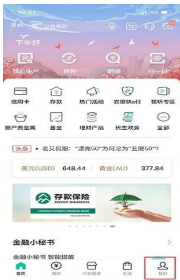
步骤 1: 打开 APP, 点击右下角“我的”