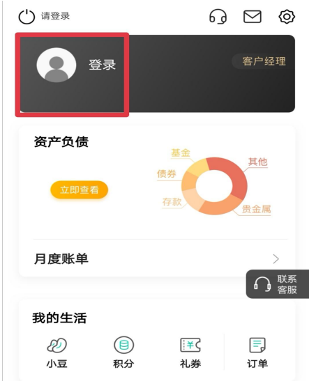
步骤 2: 点击“登录”, 输入密码