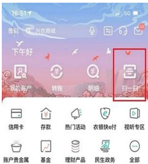
步骤 3: 登录成功后, 点击右上角“扫一扫”