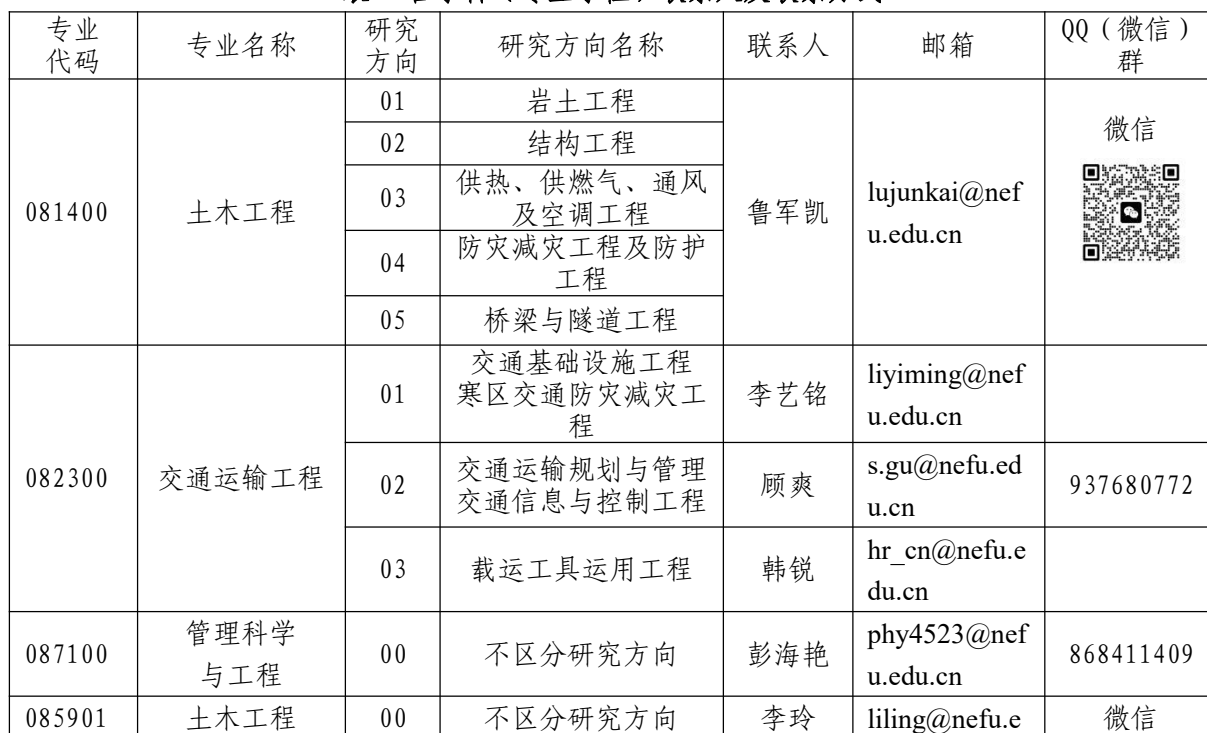
表 2 各学科（专业学位）联系人及联系方式

各招生学科（专业学位）复试群号、联系人及联系方式详见表 2（调剂考生提交时间将另行通知）：